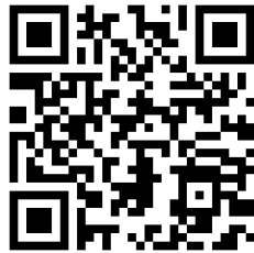
เขียนเรียงความ ป.4 - 6